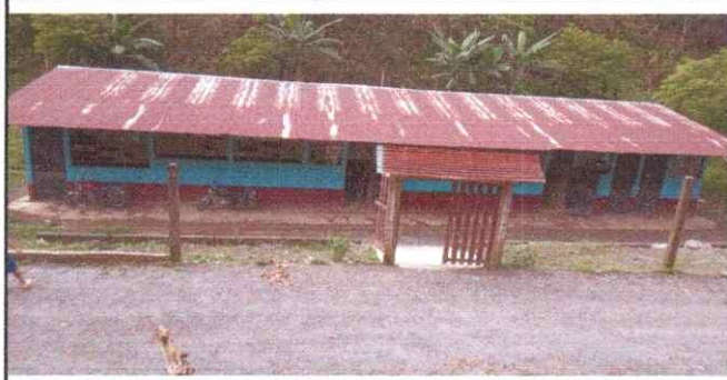
foto 1, se observa el deterioro de la cubierta de lamina asi como el mantenimiento de las costaneras de acuerdo al modulo 1 y 2