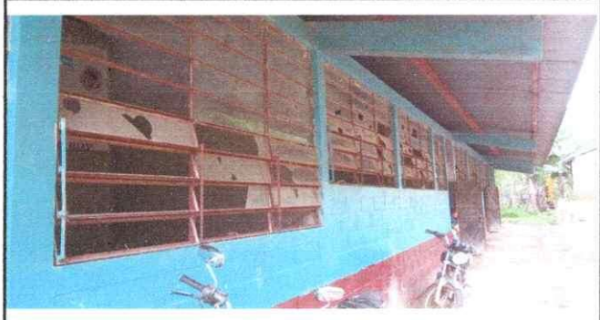
foto 4: se observa la falta de mantenimiento de las ventanas, por lo que necesita de lijada y pintura y la susticion de piezas de vidrio, de acuerdo al modulo 5 y 7