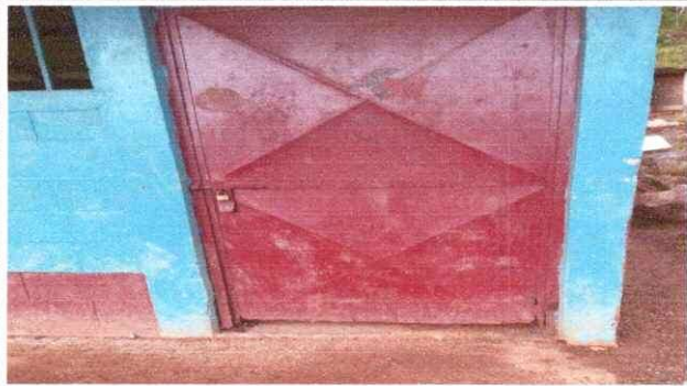
foto 3: se observa el deterioro de las puertas, por lo que necesita reparacion de acuerdo al modulo 4