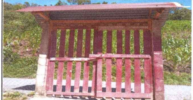
foto 2: se observa el porton actual en deterioro, se solicita uno nuevo de metal de acuerdo al modulo 3