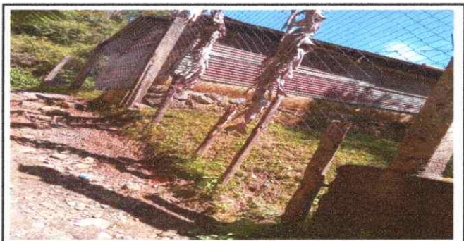
foto 6: se observa que el material que limita las colindancias del establecimiento no estan condiciones, por lo que se realizara un muro perimetral de acuerdo al modulo 8

Observación: Si es necesario se pueden agregar hojas adicionales y actualizar el número de hojas.