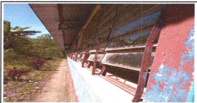
foto 5. se observa el deterioro del color de las paredes, por lo que se necesitara pintar en el exterior o en el interior del establecimiento de acuerdo al modulo 6